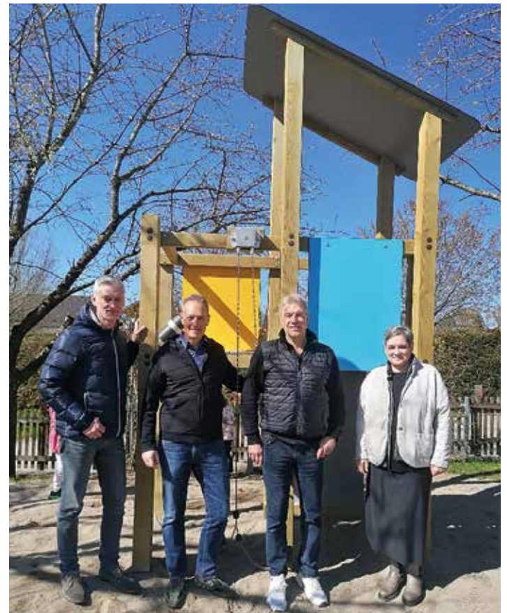
Auf dem Foto zu sehen v.l.n.r.: