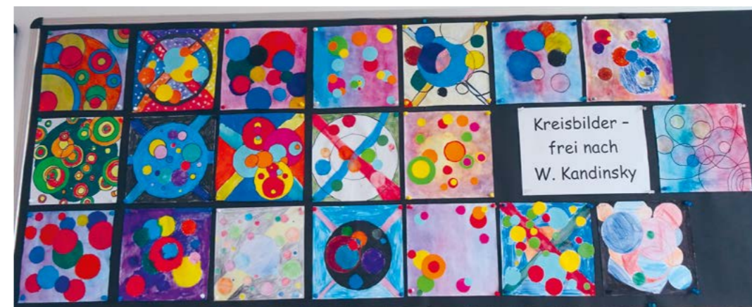
Kreisbilder - frei nach W. Kandinsky